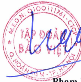
Pham Ngoc Tu